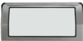
Portarrollo Industrial 300 / 500 mts