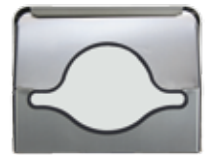
Portapaquetes Doble / Cuadruple.